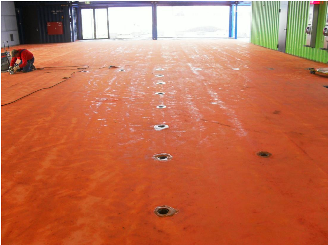
Vorbereiten des Untergrundes durch Schleifen

Der orange Farbton wurde durch das Einstreuen eines farbigen Quarzsandes in die Beschichtungsmasse erzielt. Zur besseren Griffigkeit der Oberfläche wurden in die Versiegelung kleine Glasperlen eingebracht.