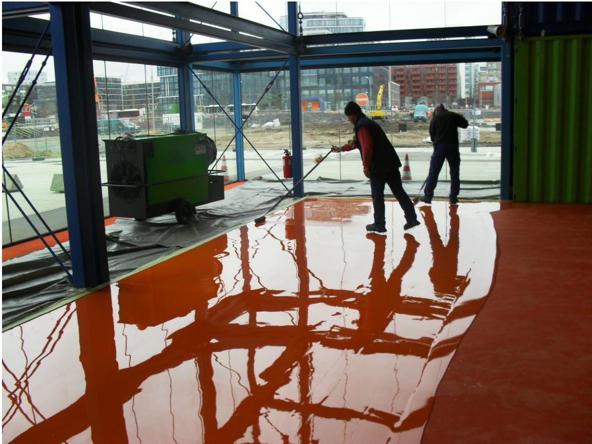
Aufbringen der Beschichtung